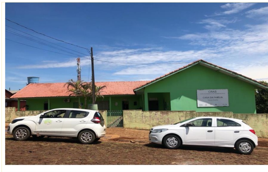
Figura 9 Figura 7 Fonte SMAS.