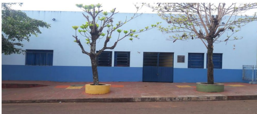
Figura 4 Fonte SMAS.