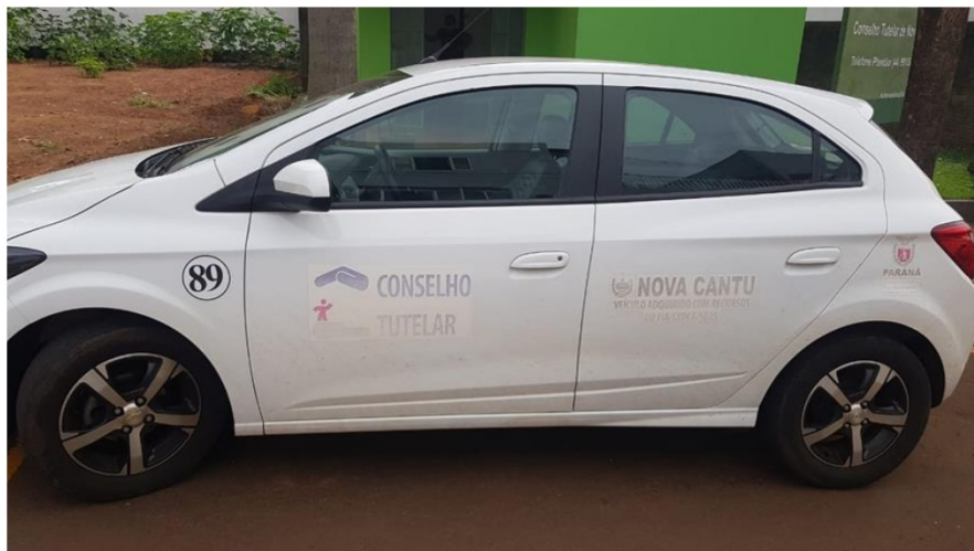
Figura 8.