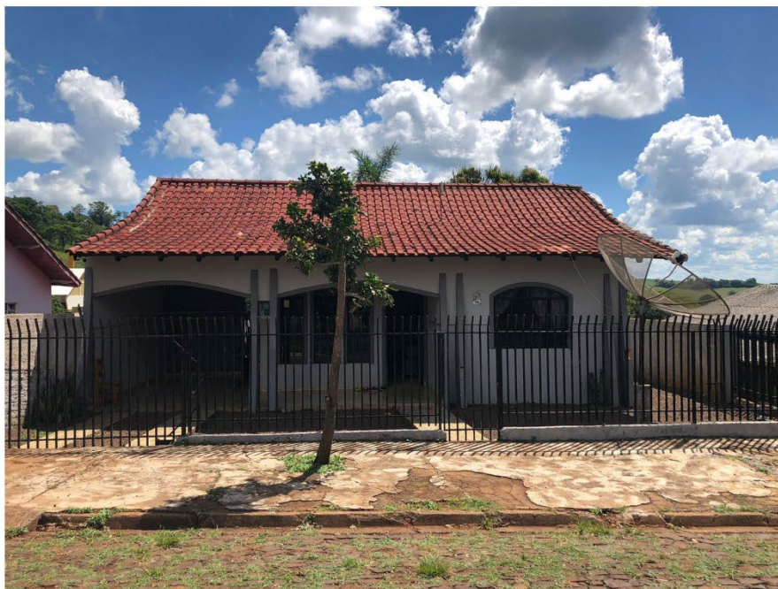
Figura 10 Fonte