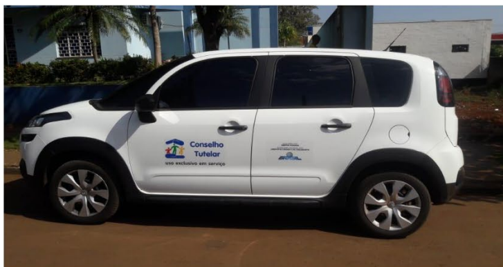
Figura 7